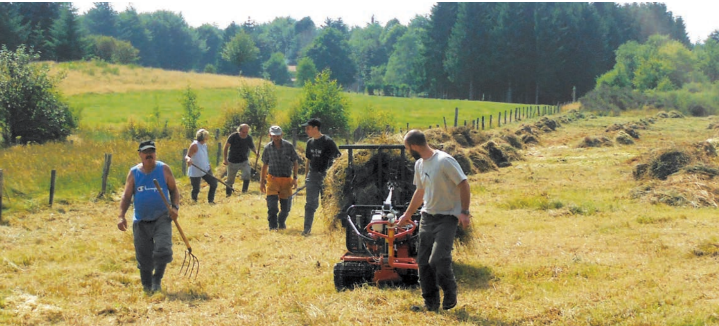
Chantier zones humides sur le plateau de la Verrerie