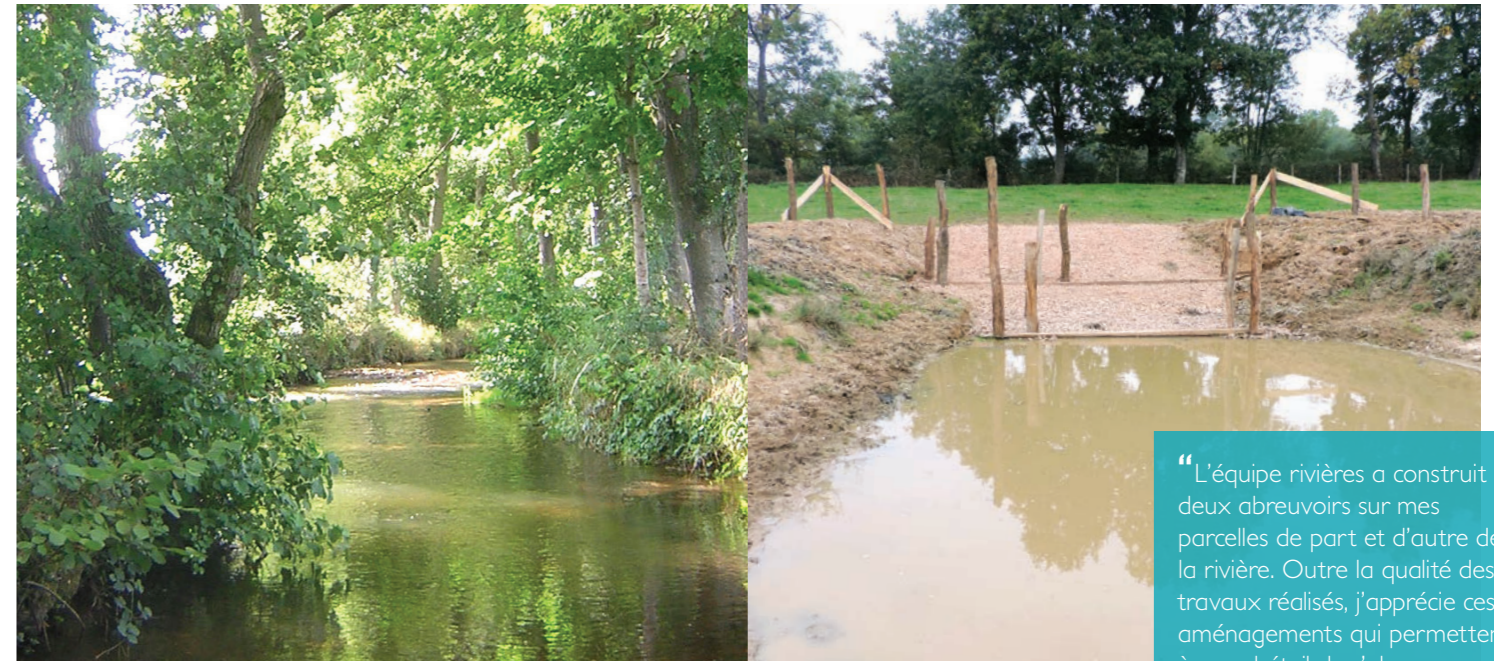
La ripisylve : un espace naturel à protéger