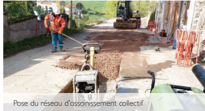
Pose du réseau d'assainissement collectif

Un réseau d'assainissement collectif est également mis en place pour transporter les eaux usées vers cette station.