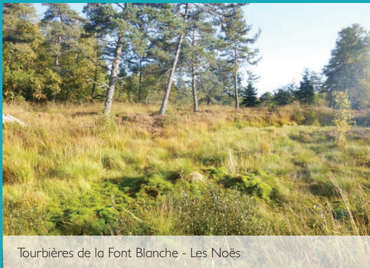
Tourbières de la Font Blanche - Les Noës

Leur sauvegarde est une obligation légale qui relève de l'intérêt général.