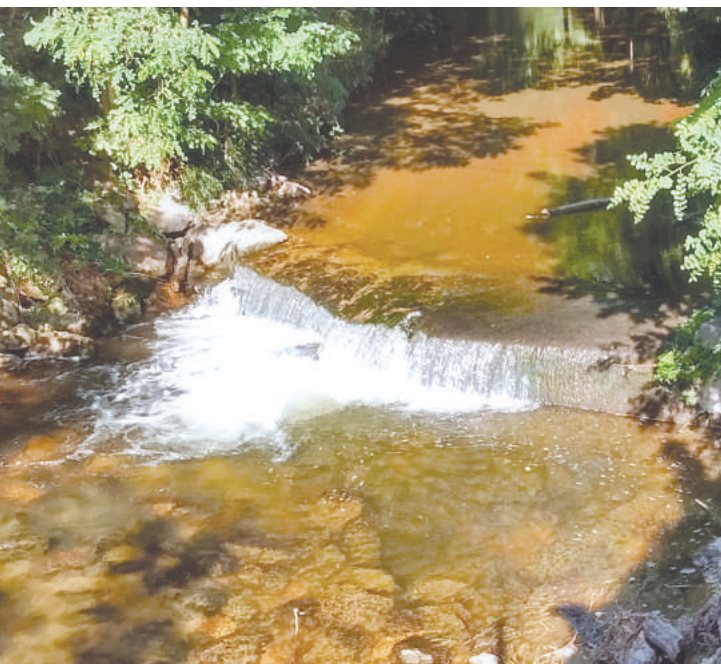
Seuil avant travaux