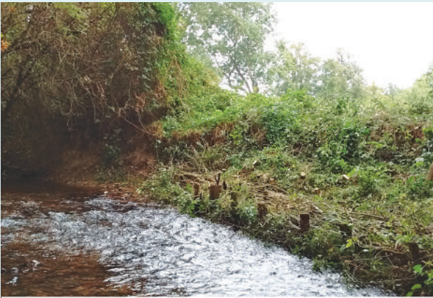
Confortement des berges - Le Renaison