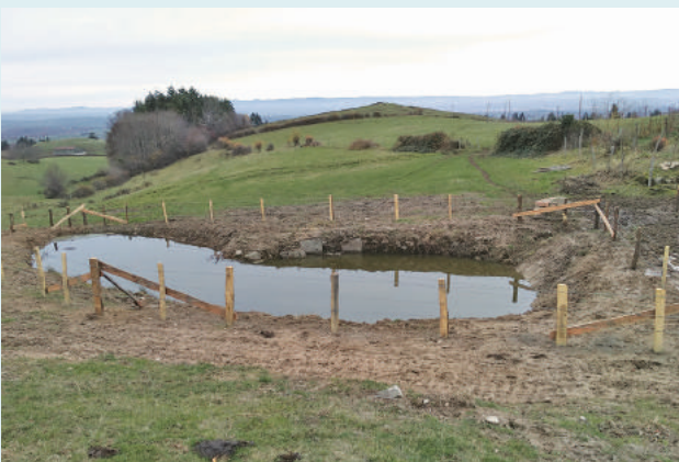
Mare agricole - Bassin versant du Renaison