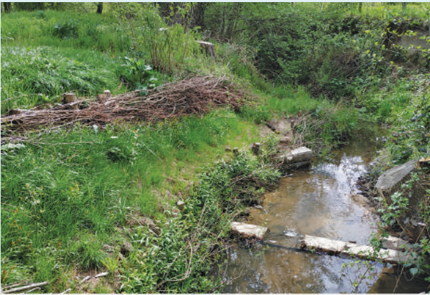
Confortement de berge - Le Maltaverne

50 % de subventions de l'Agence de l'Eau Loire Bretagne, la Région AURA, le Conseil Départemental de la Loire et le fond européen FEADER