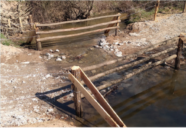
Passage à gué - L'Oudan