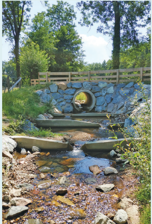
Passé à poissons - La Montouse