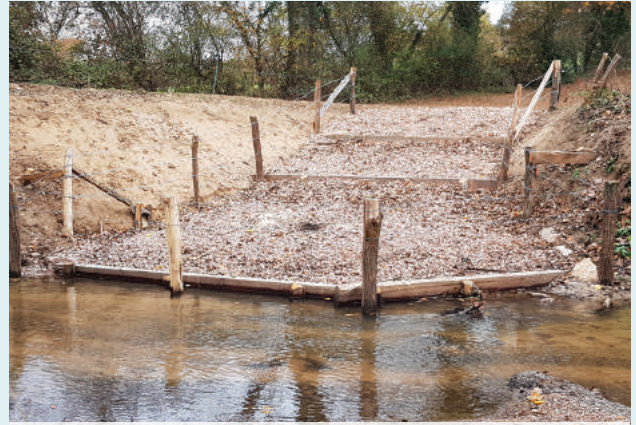
Abreuvoir - La Teyssonne